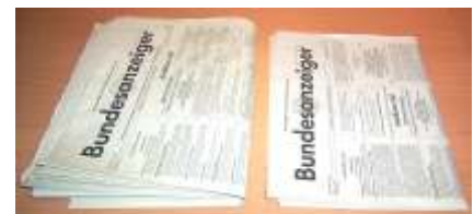
vorher/nachher: Der Umfang des Bundesanzeigers hat sich durch die Einführung des elektronischen Unternehmensregisters drastisch reduziert.