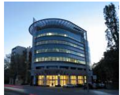
quirin bank am Kurfürstendamm

Die quirin bank aus Berlin ist der neue Stern am Privatbankenhimmel. Mit ihrem innovativen und zugleich prämierten Konzept konzentriert sie sich vor allem auf das aktive Management von Vermögen ab 50.000 Euro. Doch was ist so besonderes an dieser Bank? Es ist die Art und Weise der Geschäftstätigkeit, die vor allem durch den Verzicht auf Provisionen aller Art auffällt. Ausgabeaufschläge, Kick-Backs und versteckte Gebühren gehören der Vergangenheit an bzw. werden dem Kunden komplett zurückerstattet. Der Kunde bezahlt der Bank eine monatliche Grundgebühr; darin sind sämtliche Transaktionskosten und Beratungsleistungen enthalten. Darüber hinaus ist die Bank am Anlageerfolg beteiligt. Dem Kunden steht es frei, ob er sich zurücklehnt und das Rundum-Sorglos-Paket der Vermögensverwaltung wählt oder ob er sich für die Aktienberatung entscheidet, bei der er selbst seine Anlageentscheidungen trifft.